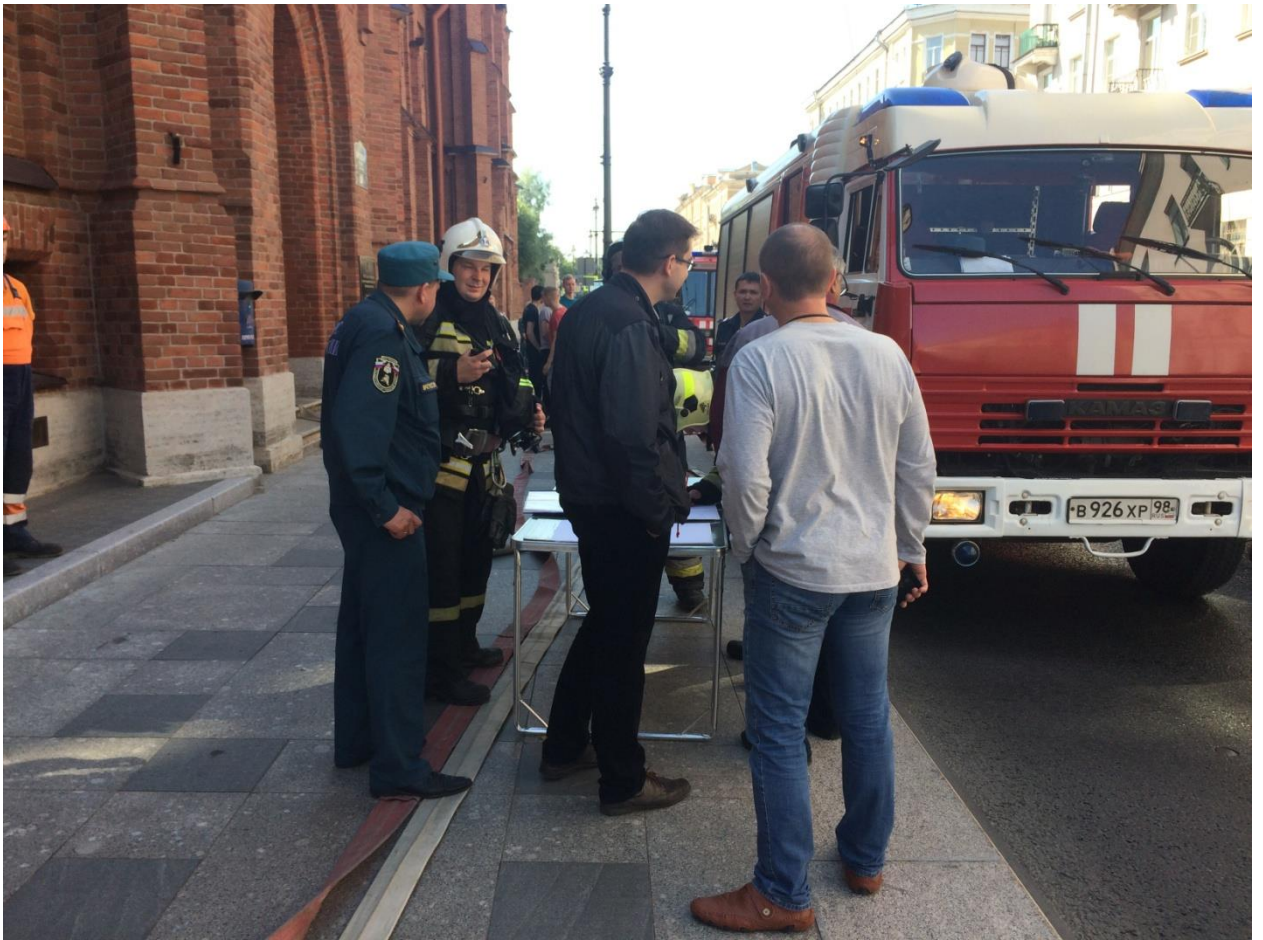
ОНДПР Центрального района 23.07.2019